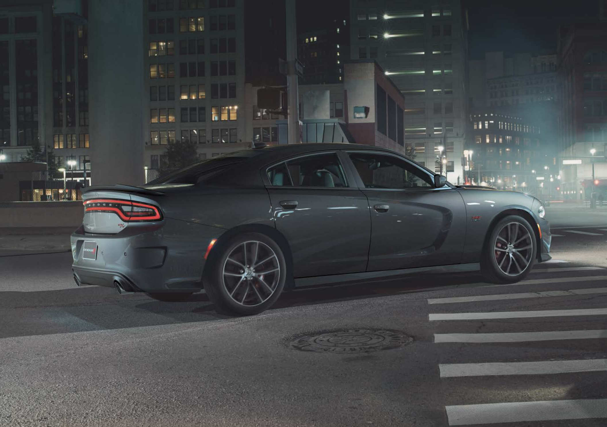
////// Charger R/T Scat Pack en granito.