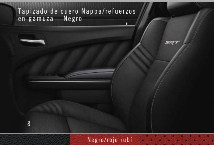
Tapizado de cuero Nappa/refuerzos en gamuza – Negro