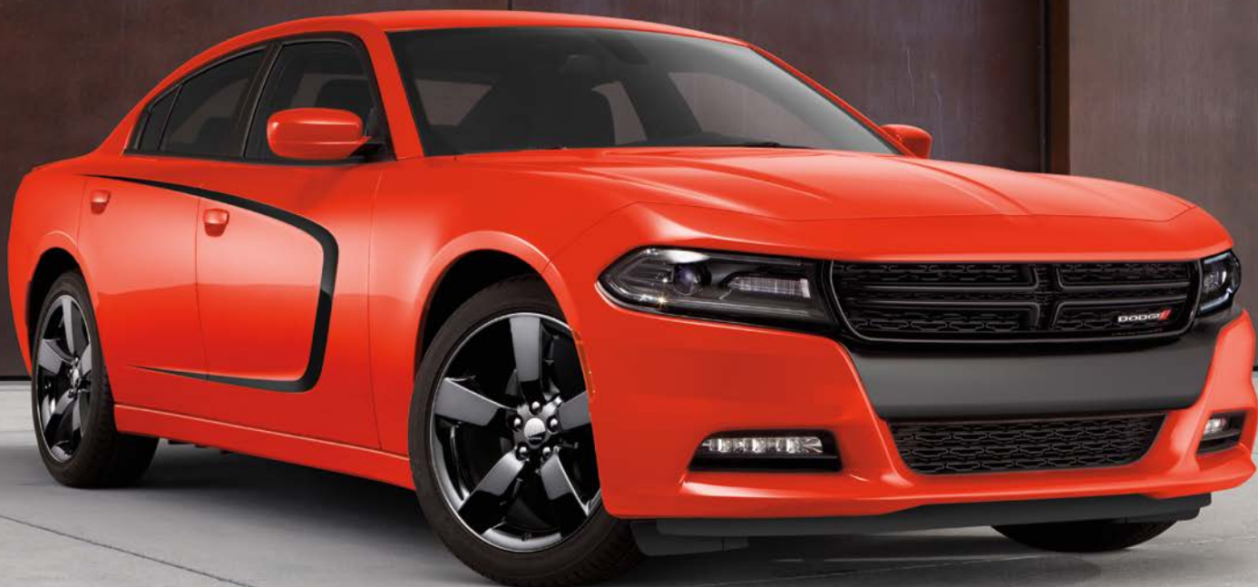
////// Dodge Charger SXT con accesorios originales Dodge provistos por Mopar®: gráfico lateral de la carrocería en negro mate y ruedas cromadas de 20 pulgadas en negro.