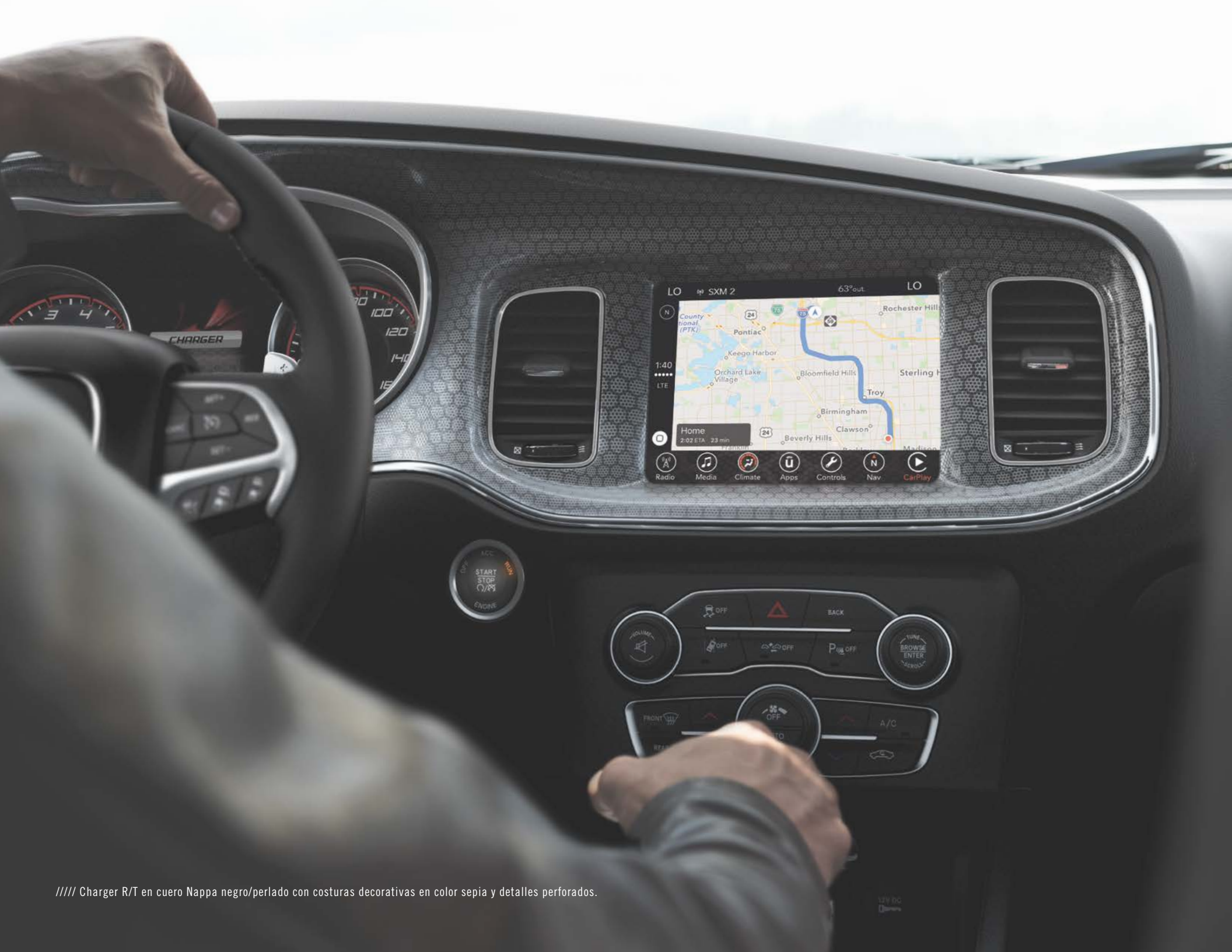
////// Charger R/T en cuero Nappa negro/perlado con costuras decorativas en color sepia y detalles perforados.