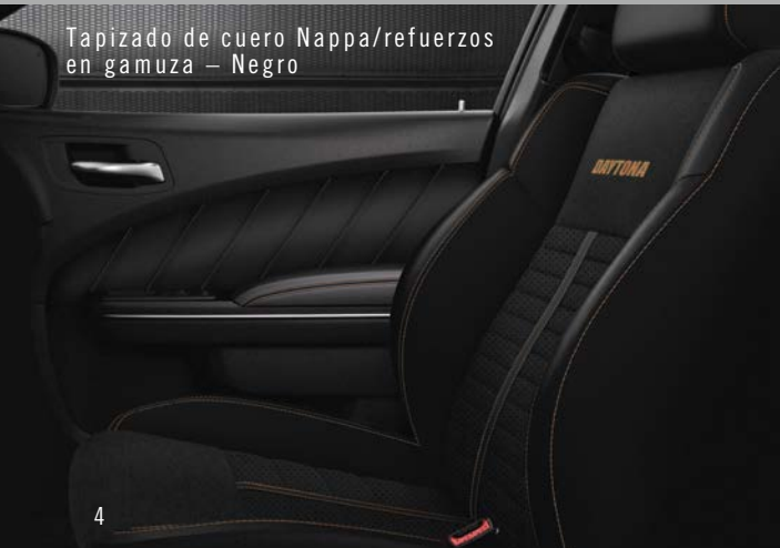
Tapizado de cuero Nappa/refuerzos en gamuza – Negro