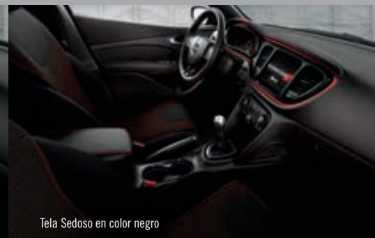
Tela Sedoso en color negro