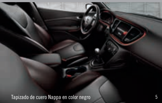
Tapizado de cuero Nappa en color negro