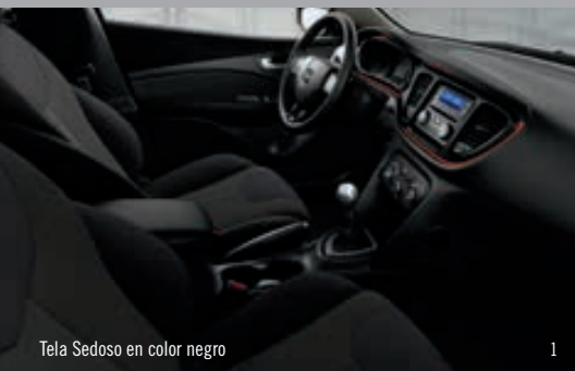
Tela Sedoso en color negro