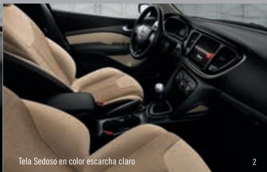
Tela Sedoso en color escarcha claro