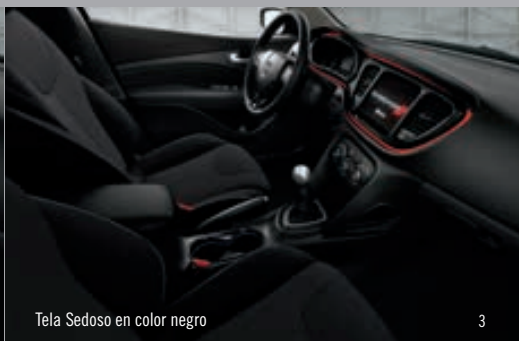
Tela Sedoso en color negro