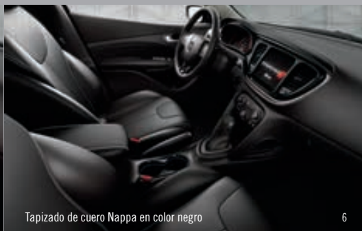
Tapizado de cuero Nappa en color negro