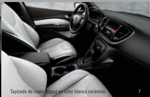
Tapizado de cuero Nappa en color blanco cerámico