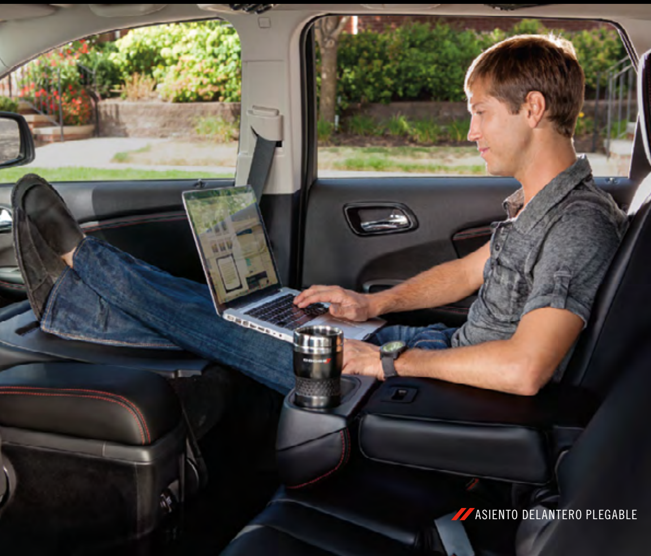
/// ASIENTO DELANTERO PLEGABLE