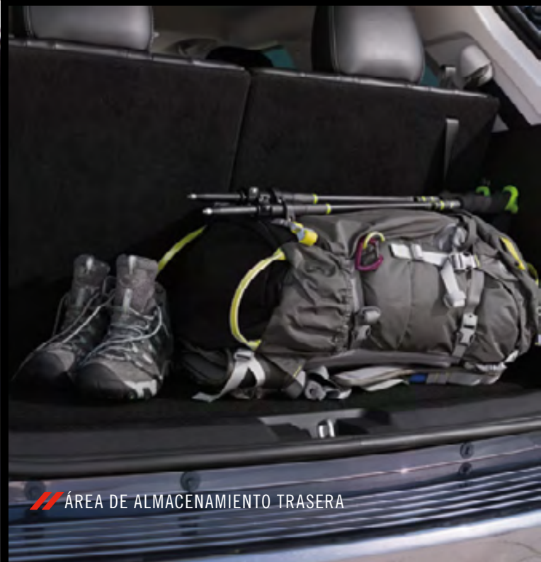
/// ÁREA DE ALMACENAMIENTO TRASERA