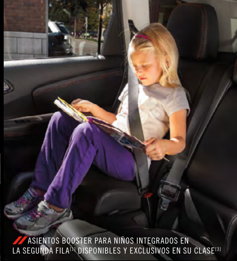
/// ASIENTOS BOOSTER PARA NIÑOS INTEGRADOS EN LA SEGUNDA FILA [1] DISPONIBLES Y EXCLUSIVOS EN SU CLASE [3]