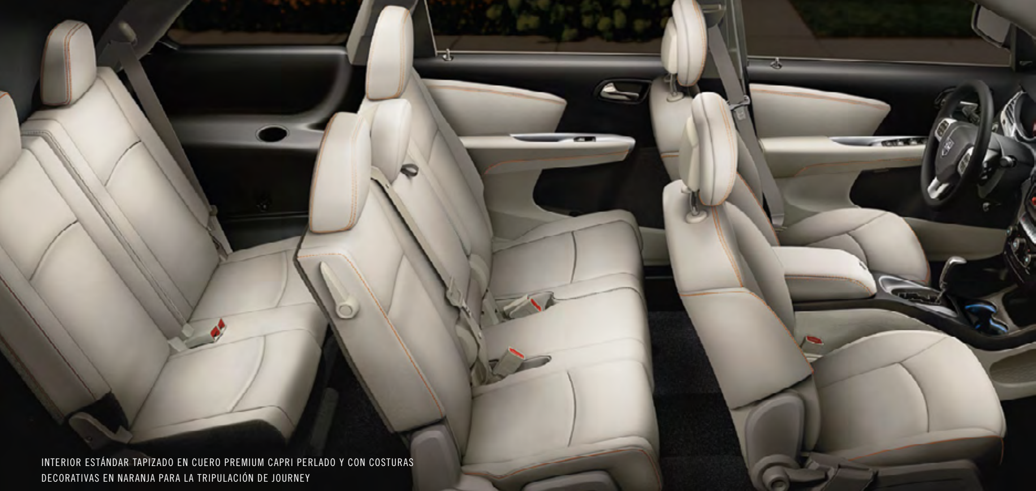
INTERIOR ESTÁNDAR TAPIZADO EN CUERO PREMIUM CAPRI PERLADO Y CON COSTURAS DECORATIVAS EN NARANJA PARA LA TRIPULACIÓN DE JOURNEY